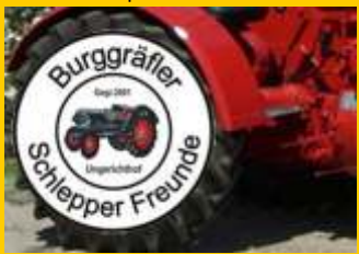
Burggräfler Schlepper Freunde