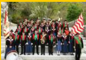
MK Burgstall - Postal