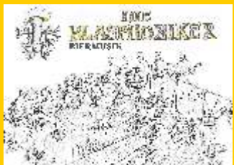
Die Blasphoniker Biermusik