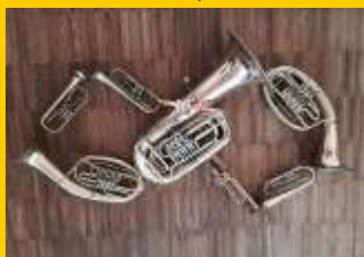
Glorreichen 8 - Lana