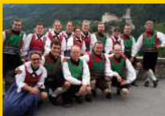
Volkstanzgruppe Burgstall - Postal