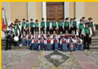
MK Gargazon - Gargazzone