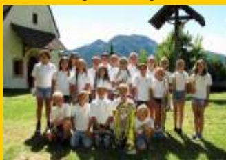
JuKaB Burgstall - Postal